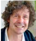
Foto-Designer Lazi Akademie Stuttgart www.andreas-sauer-fotodesign.com